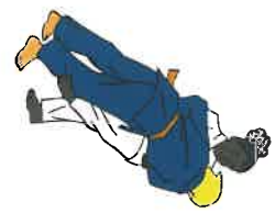
De-ashi-barai Voorste beenveeg