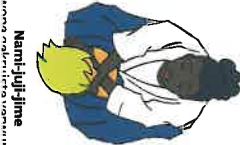
Nami-juji-jime Crossing collar choke