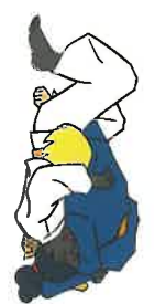
Yoko-siho-gatame Zijwaartse 4-puntencontrole