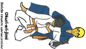
Okuri-eri-jime Beide reverses verwurdingen