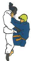
Tori ring Uke tussen benen