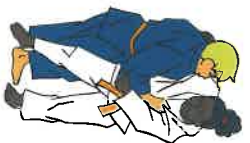
O-soto-gari Grote buitenwaartse maai