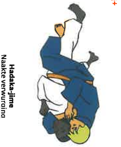
Hada-ka-jime Naakte verwurding