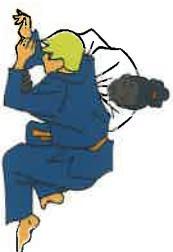
Uke bok Ellebogen/Knieën