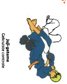
Juji-gatame Gekruiste controle