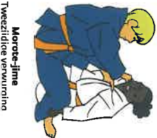
Morote-jime Tweezijdige verwurding