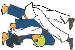
O-goshi Grote heup