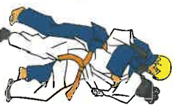
Ippon-seoi-nage Eenzijdige rugworp